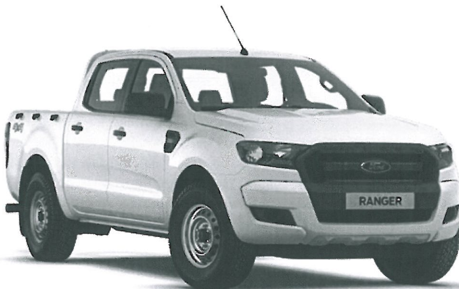
A kép illusztráció.